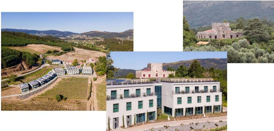
Figura 3 - Monumento de interesse público, classificado em 1977 e paisagem cultural relevante. Substituição das infraestruturas agrícolas por novos edifícios com excessiva volumetria e proximidade ao monumento. Perda de visibilidade sobre o Paço. O Património Cultural I.P. reconheceu o “impacto irreversível da operação urbanística sobre o bem classificado e a área envolvente”.