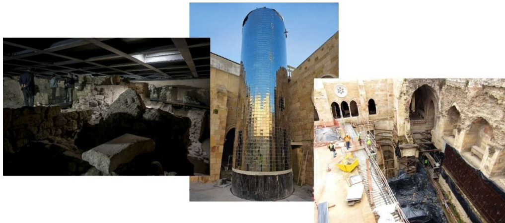
Figura 4 - Monumento Nacional desde 1907, a Sé Patriarcal de Lisboa foi recentemente objeto de uma intervenção de motivação turística, altamente intrusiva, que envolveu demolições de partes relevantes do edifício e do seu património arqueológico. No interior do claustro foram construídas estruturas de aço e betão pesando várias centenas de toneladas, em grande parte fixadas por varões de aço às alvenarias antigas ou ancoradas nas formações envolventes. As estruturas arqueológicas foram perfuradas por mais de duas centenas de estacas tubulares de aço, seladas nessas estruturas através da injeção de calda de cimento. A reversão é impensável, pelas destruições adicionais que provocaria. A intervenção incluiu a construção de uma torre espelhada, com um peso de mais de 150 toneladas, que obrigou à execução de quatro dezenas de estacas e à demolição de estruturas arqueológicas relevantes.