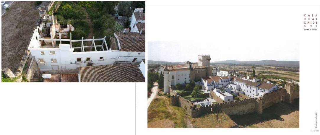
Figura 2 - Casa do Alcaide-Mor (Estremoz, Monumento Nacional): Depois de anos de ausência de manutenção, apesar de estar na posse do município foi vendida em hasta pública por uma verba irrisória. O projeto imobiliário envolveu a demolição da maior parte do edifício antigo, de alvenaria e madeira e substituição das estruturas antigas por lajes, vigas e pilares de betão armado. A fachada principal, quinhentista, foi demolida em cerca de 2/3 e reconstruída incorporando pilares e vigas de betão armado! A intervenção foi objeto de uma queixa-crime, apresentada em janeiro de 2022 pela associação local "CIDADE", pela associação Amigos dos Castelos e pelo GECORPA.