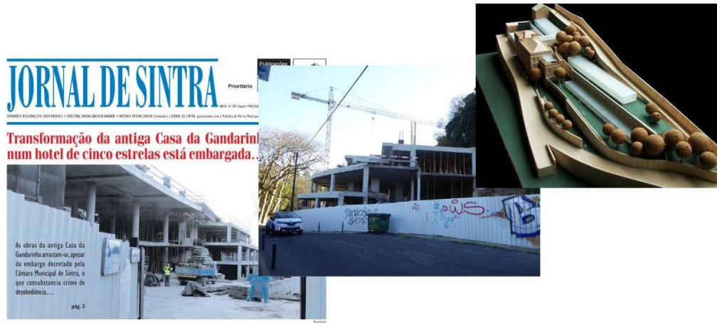
Figura 1 - Casa da Gandarinha (Sintra): Em plena zona da Paisagem Cultural de Sintra, classificada, desde 1995, pela UNESCO, como Património Cultural da Humanidade. Apesar dos esforços da associação QSintra, que envolveu inclusive uma ação de providência cautelar, não foi possível evitar a descaracterização da paisagem envolvente, com as novas construções de betão armado e a artificialização do terreno.